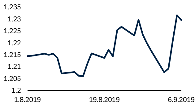
Grafico 2: l'andamento del cambio GBP/USD

Dati aggiornati al 6 settembre 2019